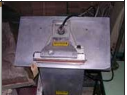
#21 Machine à sceller les sacs FRANCESSE 8R