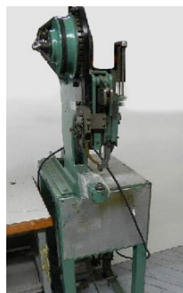
#92 Riveteuse électrique (échange avec Corgo pour No 33 (2003)