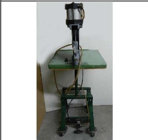
#10. Kick press pneumatique