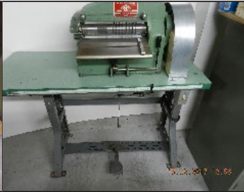
#2. Morpan 12"