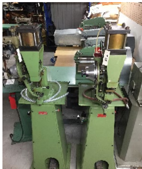
#47 et 48 Machine B-pression pneu- matique semi-auto (8031/8041)