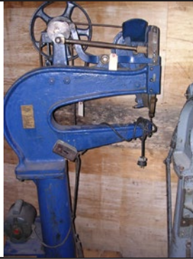
#36 Machine à petits rivets