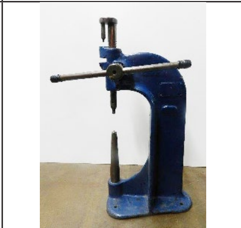
#11. Riveteuse à patin