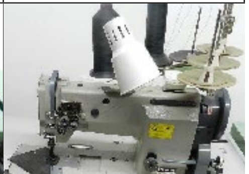
#34 Machine à coudre wf 2 aiguilles (1/2") Reliable MSK-8420B