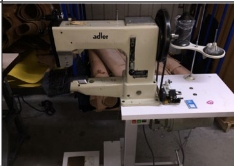
#5. Machine à coudre w.f. de sellier Adler 205.