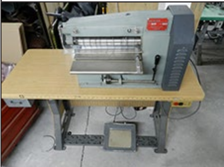
#4. Morpan 12"