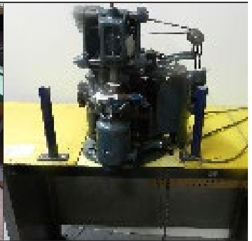
#16 Machine à perforation variable