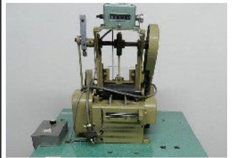
#46 Guillotine Ace