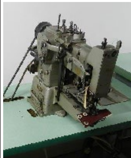
#50 Pfaff Tacker boutonniere 33-958- 01 9/03-b