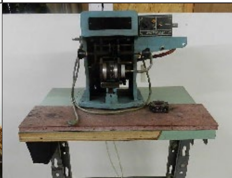
#19 Marqueur à peinture (Markem)