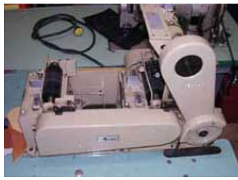
#35 Guillotine Ace (Prod.)