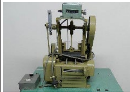
#41 Guillotine Ace