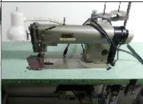
#32 Machine à coudre à roulette Pfaff 463 auto