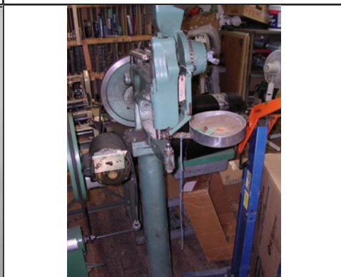
#26 Riveteuse électrique (Cuirs Veilleux)