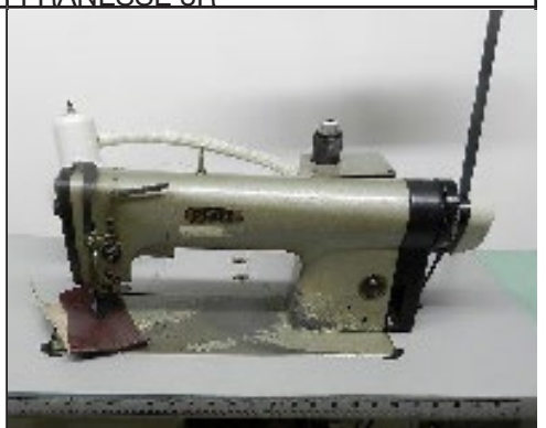
#30 Machine à coudre à roulette Pfaff 463 auto