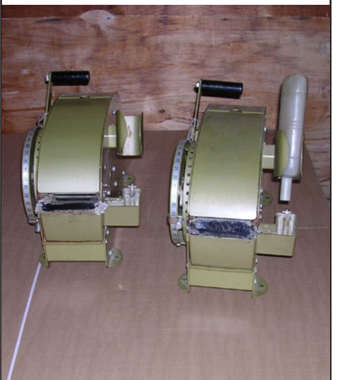
#67 et #68 Machine à ruban d'embal- lage