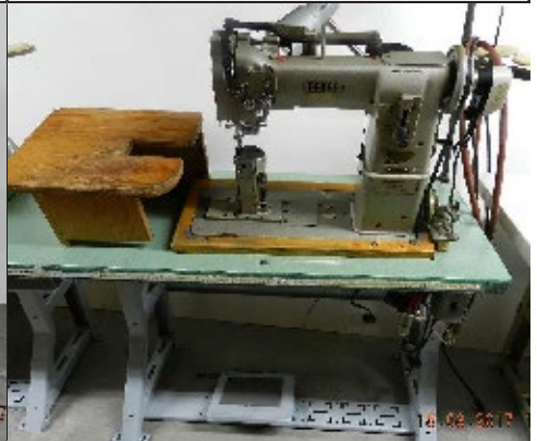
#9. Machine à coudre wf Pfaff 595 auto