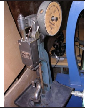
#39 Automatique soling machine