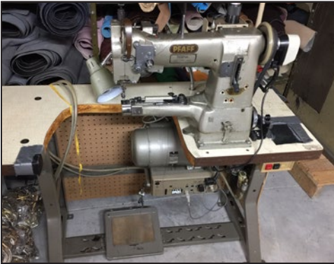
#1. Machine à coudre w.f. pfaff 335 électronique.