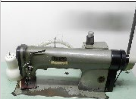
#31 Machine à coudre à roulette Pfaff 463 auto