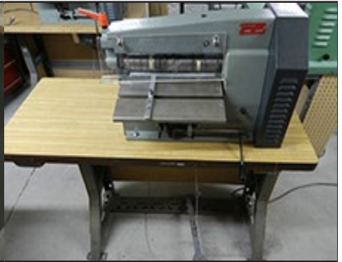
#3. Morpan 12"