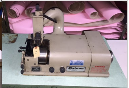
#6. Pareuse Fortuna