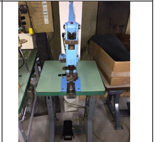
#12. Kick press pneumatique.