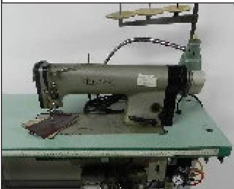
#25 Machine à coudre à plateau needle feet Pfaff 463 auto