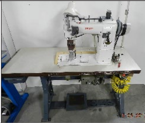
#8. Machine à coudre wf Pfaff 595 auto