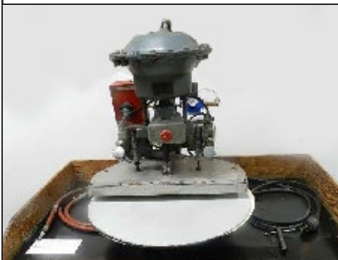
#17 Presse chauffante à doublure