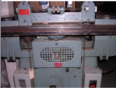
#13 Fendeur à cuir USM (Prod.)